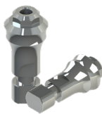
Análogo SO 100736AP